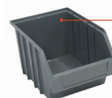
BACS GRIS 3L :

Dim. hors tout : L.150 x P.225 x H.125 mm