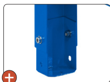
Hauteur ajustable 850 ou 900 mm Fixation au sol possible