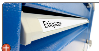
Poignée avec porte-étiquette