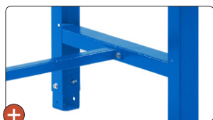
Traverse de liaison renforçant la stabilité de l'établi