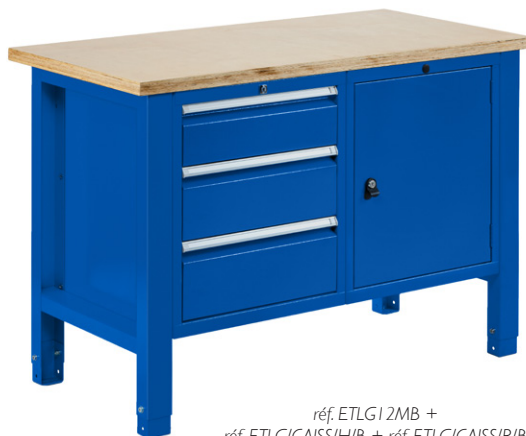
réf. ETLG12MB + réf. ETLG/CAISS/H/B + réf. ETLG/CAISS/R/B