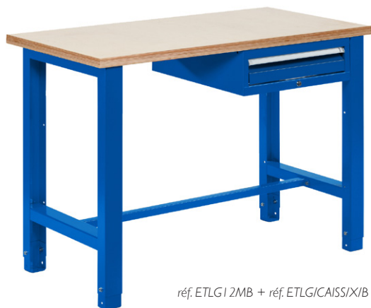
réf. ETLG12MB + réf. ETLG/CAISS/X/B