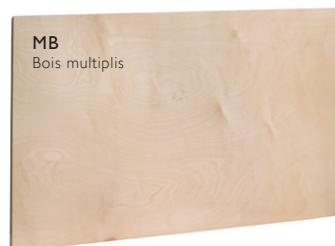
MB Bois multiplis