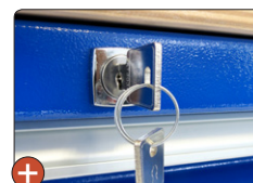
Fermeture centralisée pour les tiroirs