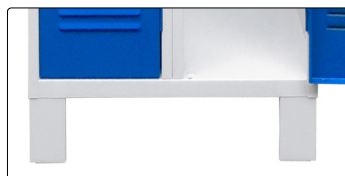
Pieds soudés tôlés réf. PIEDS/SOUD

Ils surélevant les vestiaires pour améliorer l'hygiène et faciliter le nettoyage des sols. Hauteur : 140 mm.