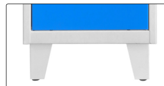
Pieds soudés avec vérins de réglage réf. PIEDS/VERINS/VEST