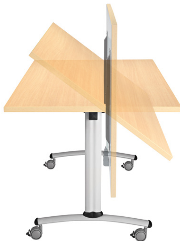
Installation simple, rapide et sans effort TMR/160X80/R