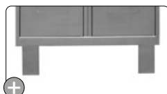
Option : pieds en inox soudés