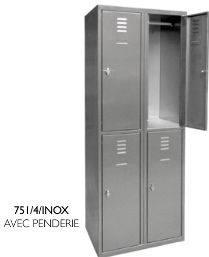
751/4/INOX AVEC PENDERIE